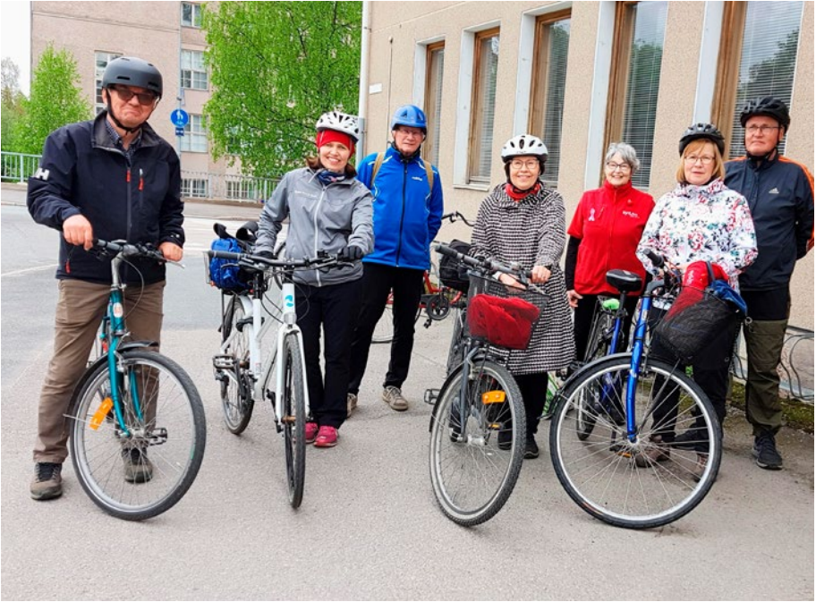
Pyöräilijät lähdössä metsäkonserttiin.