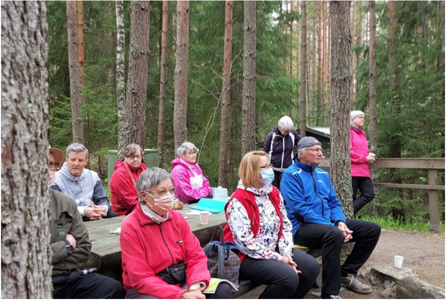
Metsäkonsertti Latumiilun majalla.