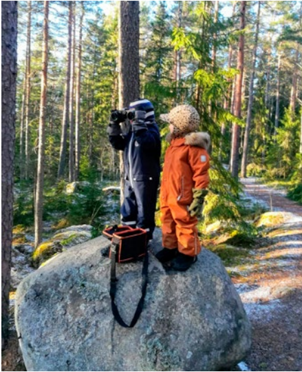
Ornitologit Hyvinkään Sveitsissä.

ti 14.9. klo 10 Ulkoliikuntakerho aloittaa.