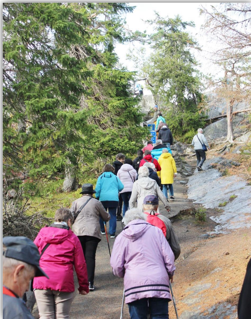
Jyväskylän Sydänyhdistyksen matkalla vuonna 2019 kiivettiin Kolin huipulle. Toivottavasti pian päästään uudelleen.