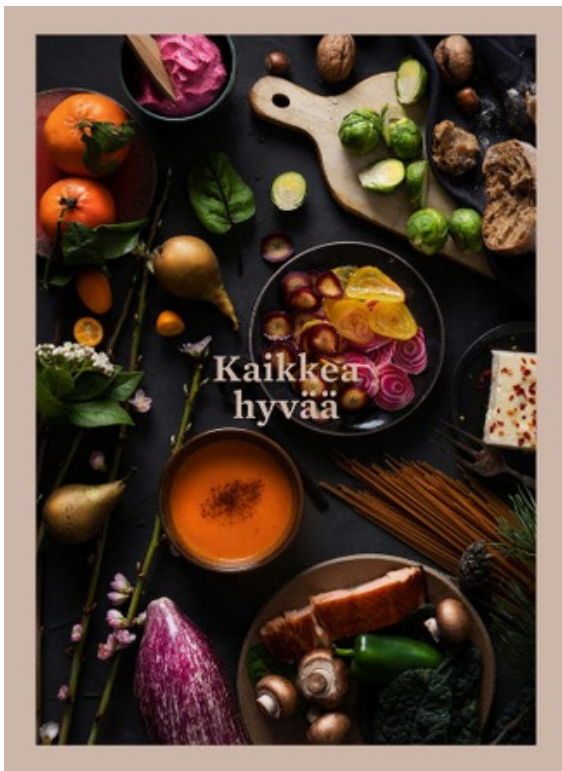
Kaikkea hyvää - ruokakirja

Maksu onnistuu joko käteis- tai korttimaksuna! Jatkoissa maksutapana käy myös e-passi sekä Finnair-plussapisteet.