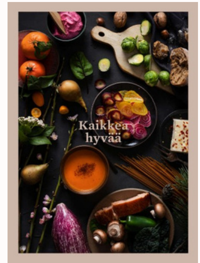
Kaikkea hyvää - ruokakirja

Maksu onnistuu joko käteis- tai korttimaksuna!